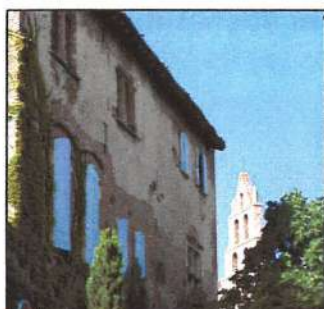
La bastide et l'église

Tél : 05 61 81 52 75. www.journeesdupatrimoine.culture.fr