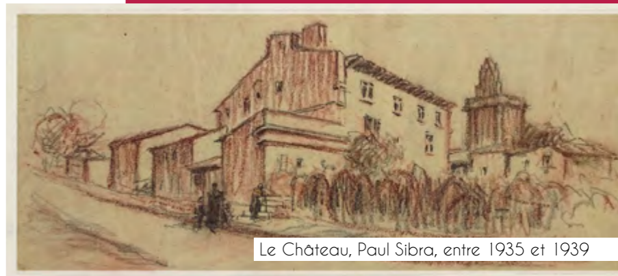
Le Château, Paul Sibra, entre 1935 et 1939