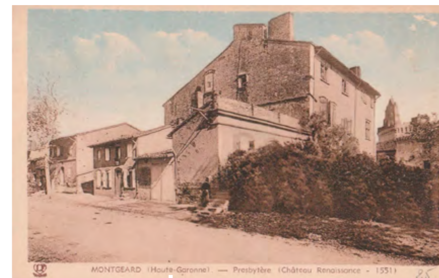
VUE SUR LE PRESBYTÈRE & LE CHÂTEAU RENAISSANCE - 1551