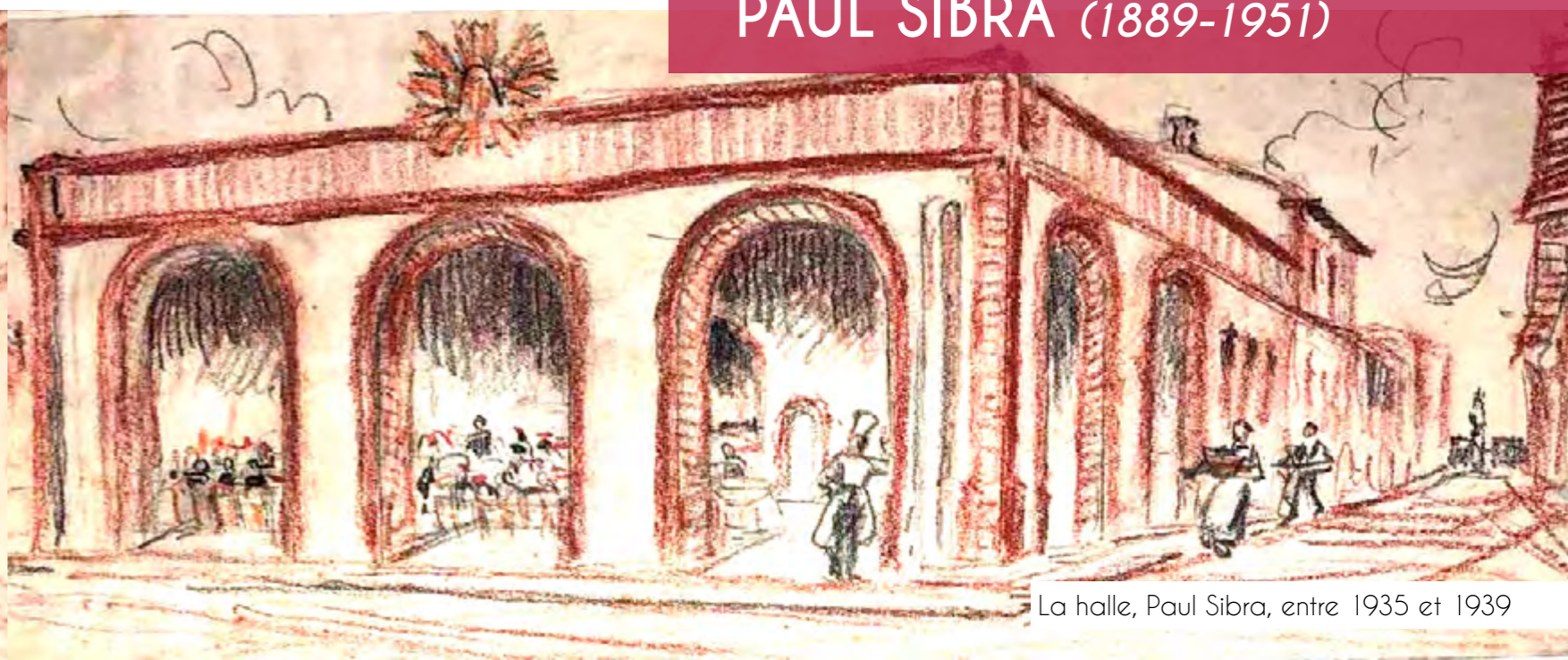
La halle, Paul Sibra, entre 1935 et 1939