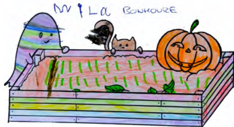
Félicitations à Mila pour ce très beau coloriage de son potager idéal d'Halloween !

à ton tour, dessine les plus belles fleurs de printemps, et viens déposer ton oeuvre à la mairie !