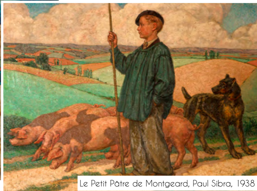
Le Petit Pâtre de Montgeard, Paul Sibra, 1938

En 1920 il achève sa formation artistique à Paris. Une dizaine d'années plus tard, il revient s'installer définitivement à Castelnaudary. Sibra aime profondément sa région natale. Il la parcourt souvent à la recherche de sujets à peindre : ses thèmes de prédilection sont le monde paysan, les scènes de la vie quotidienne et les paysages. Son tableau le plus célèbre s'intitule d'ailleurs « Le Lauragais », qu'il