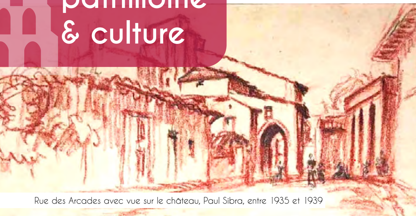
Rue des Arcades avec vue sur le château, Paul Sibra, entre 1935 et 1939